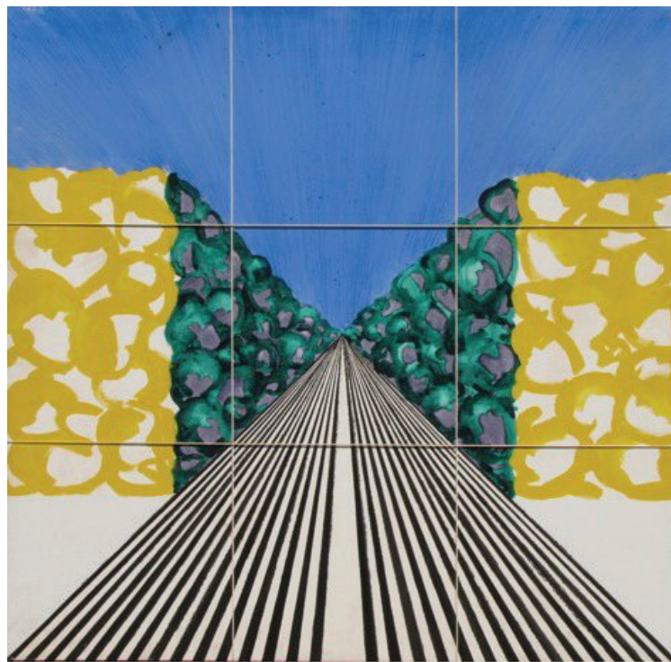
Opera pubblica 1976

Il percorso umano e artistico di Livio Borghi, proseguito nel corso degli anni con raro rigore, meriterebbe di essere studiato e approfondito attraverso un'attenta e accurata lettura complessiva delle sue opere: dipinti, fotografie e scritti. Un percorso di appassionata ricerca del “fare arte” che sarebbe importante raccontare, descrivere e presentare in forma antologica a chiunque fosse interessato all'arte, all'ambiente, alla cultura, lasciandoci interrogare dai colori, dalla luce, dalle