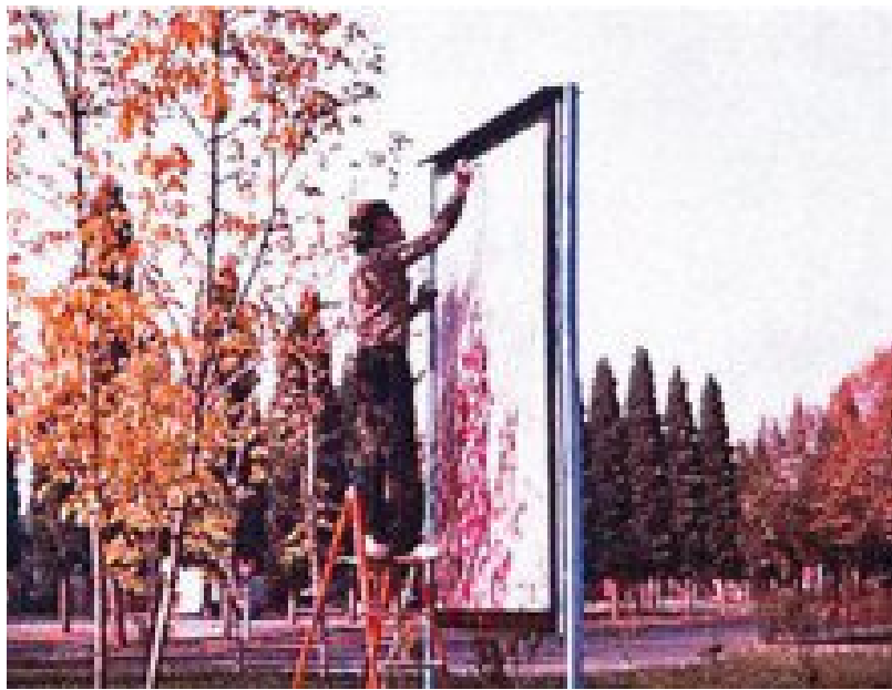
Livio Borghi - Intervento a Rescaldin 1985