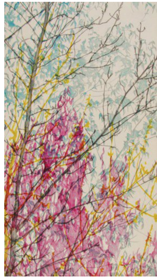
Quattro stagioni 1985