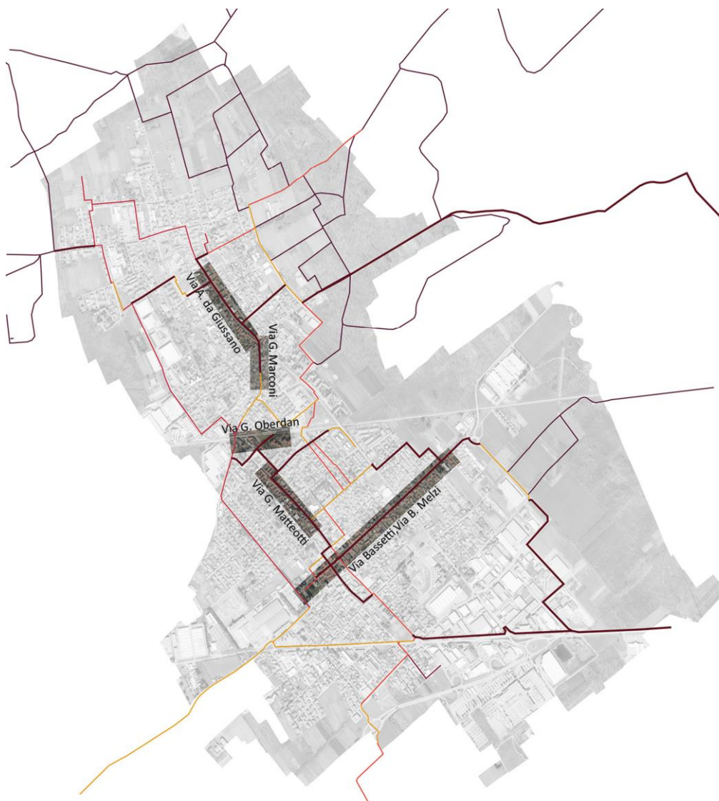
Figura 1 Transetti urbani